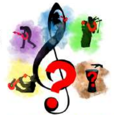
journée "concert éphémère"

Lors de la journée "regards croisés" du 19 octobre, nous avons dû composer avec le thème des couleurs. Ce fut pour les artistes présents ou en "télétravail" l'occasion de proposer des créations musicales alliant Bach et Vivaldi aux cornemuses et flûtes gasconnes, les passages écrits et les improvisations. Nous avons aussi pu exposer des portraits et autres dessins pour lesquels l'utilisation de la lampe torche du téléphone permettait de révéler les détails cachés, des photos qui nous arrivaient parfois de très loin (Martinique). Nous avons aussi pu rédiger et imprimer une nouvelle littéraire d'une douzaine de pages.