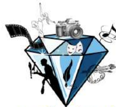
journée "regards croisés"